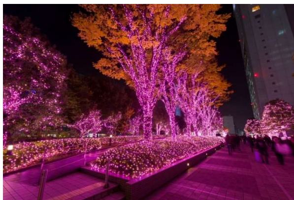
新宿サザンテラス