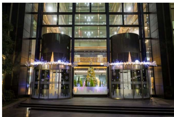
新宿マインズタワー