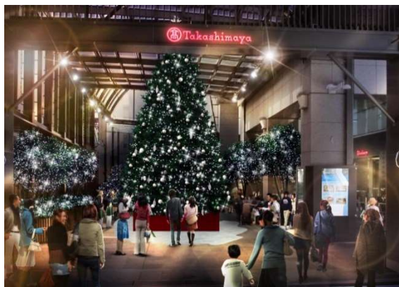
タカシマヤ タイムズスクエア