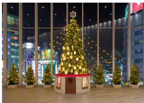
JR 新宿ミライナタワー